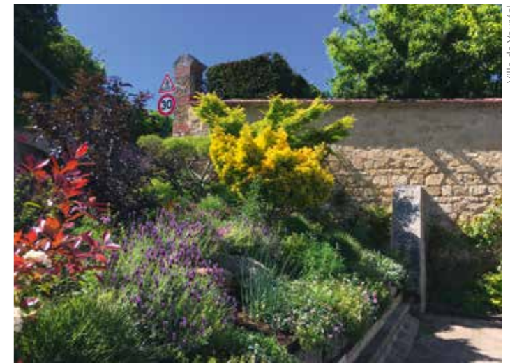
Ville de Vauréal