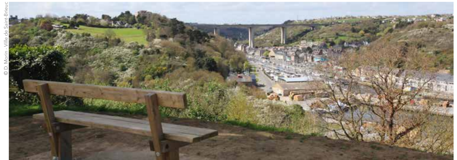
© D. Morin - Ville de Saint-Brieuc